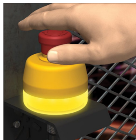
Obr. 3. Tlačítko nouzového zastavení se základnou s osvětlením LED