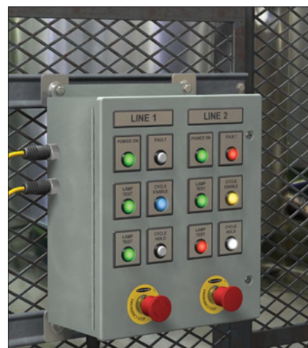
Obr. 4. Indikátory EZ-Light S18L instalované v panelu zobrazující stavy strojů a zařízení