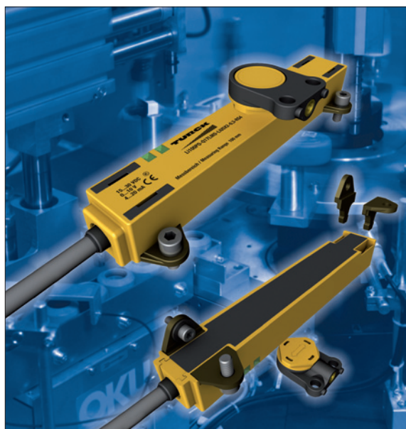
Obr. 2. Miniaturní senzory LI-Q17 pro sledování lineární polohy a pohybu