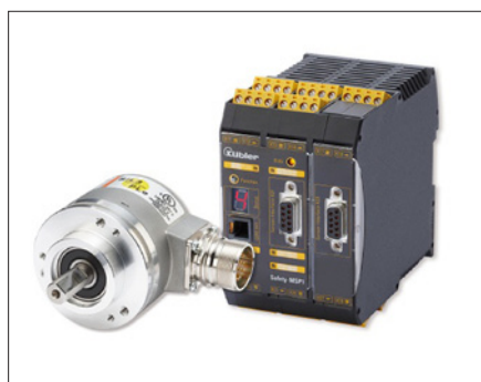
Obr. 1. Bezpečnostní modul Safety-M pro sledování pohybu a polohy

Společnost Fritz Kübler GmbH, jeden z významných partnerů společnosti Turck, rozšířila sortiment svých výrobků o bezpeč-