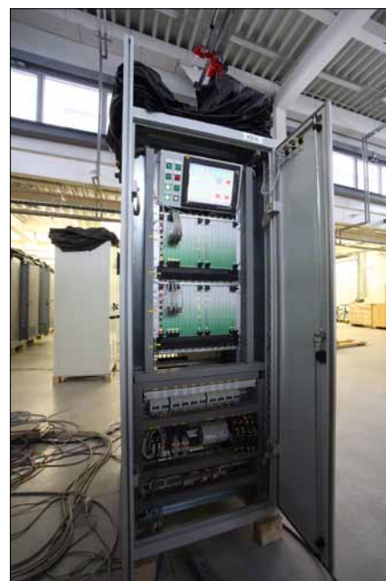
Obr. 4. Rozváděčová skříň se dvěma řídicími stanicemi Z200

a sleduje pohyb regulačních tyčí jaderného reaktoru; umístěn je ve 34 rozváděčových skříních a obsahuje 1 270 samostatných elektronických komponent, z toho více než 400 mikropočítačových desek (Z100, Z200),