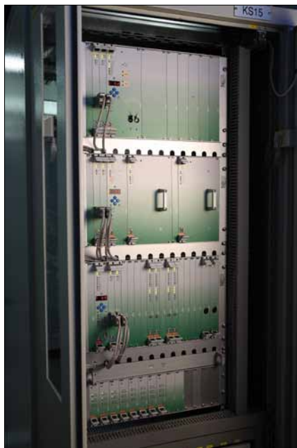
Obr. 3. Speciální řídicí stanice řady Z100