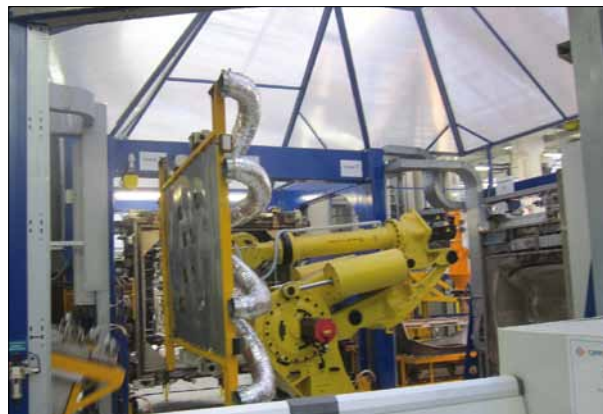
Obr. 2. Robot přenáší desku s ohřívačí vzduchu

Forma se předehřeje v předehřívacím rámu (obr. 1), poté je ramenem robotu uchopena, přenesena a upevněna do rotačního rámu tvořící jednotky. Tam je dále ohřívána a nato je na ni nanášen práškový elastomer. Robot uchopí desku s ohřívačí vzduchu a upne ji na formu v tvořící jednotce. Forma je s naneseným práškem dohřívána ohřátým vzduchem z této desky.