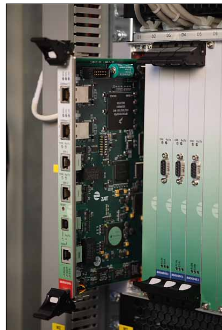
Obr. 2. Řídicí deska (CPU) stanice řady Z200

Řídicí stanice SandRA Z200 se skládá ze šasi nabízeného ve dvou variantách (pro deset nebo 21 zásuvných desek) a souboru zásuvných