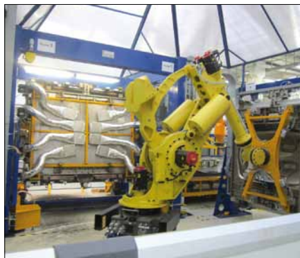
Obr. 1. Robot zakládá formu do předehřívacího rámu

Sériová linka na výrobu umělé kůže byla navržena ve spolupráci se systémovým integrátorem, firmou Aura Engineering, a uvede-