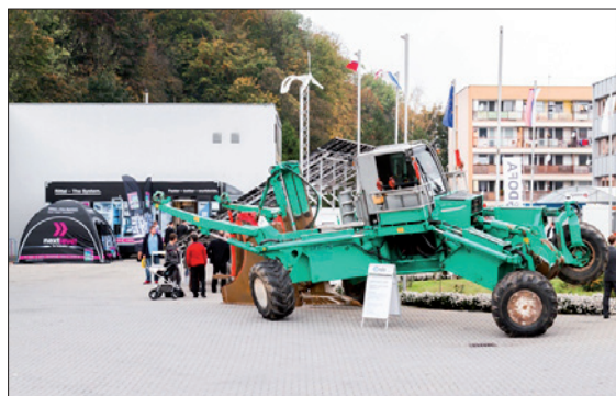
Obr. 1. Výstavné expozície veľtrhu Elo Sys sú umiestnené v halách aj na voľnej ploche výstavniska Expo Center v Trenčíne

skum sa už roky snaží Slovenská spoločnosť elektronikov Bratislava organizovaním Celoslovenského finále technickej súťaže mladých elektronikov. Slovenská agentúra