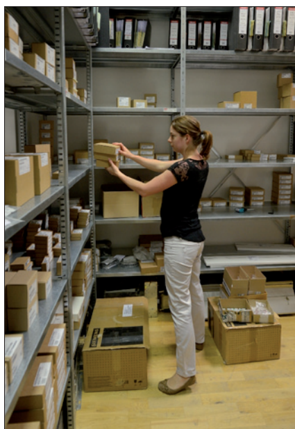
Obr. 2. Pohled do jedné z místností pohotovostního skladu

Služby produktové úrovně jsou vhodné pro případy, kdy je příčinou provozní poruchy chybná funkce, popř. závada použitého produktu třetích stran (pro profesionální a rychlé řešení takovýchto případů má společnost Sidat s většinou výrobců a dodavatelů uzavřeny partnerské smlouvy).