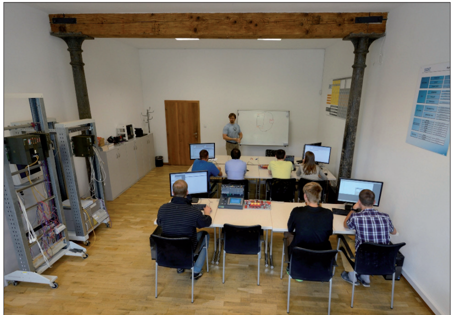
Obr. 1. Velká učebna školicího střediska

učebny, schopné pojmout větší počet zájemců. Kalendář termínů bude na www.sidat.cz zveřejněn na počátku srpna 2015, kurzy budou zahájeny v říjnu 2015.