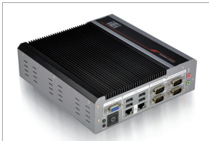
Obr. 1. Vestavný počítač TANK-600

Tank-600 (obr. 1) je kompaktní vestavný ( embedded ) minipočítač s odolným hliníkovým krytem opatřeným pasivním chladičem, který vyplňuje celou horní stranu šasi. Výpočetní výkon počítače je zajištěn dvoujádrovým procesorem Intel Atom D2550 s frekvencí 1,86 GHz nebo Intel Atom N2600 s frekvencí 1,6 GHz. Počítač je vybaven množstvím komunikačních rozhraní: má dvě gigabitová rozhraní LAN pro vysokorychlostní síťovou komunikaci, šest USB 2.0 a popř. jedno VGA. Tank-600 je však výjimečný především velkým počtem rozhraní COM pro klasickou sériovou komunikaci RS-232, RS-422 nebo RS-485 – celkem jich má až šestnáct. Aby bylo možné zachovat malé rozměry počítače, je osm z šestnácti možných portů RS-232 vyve-