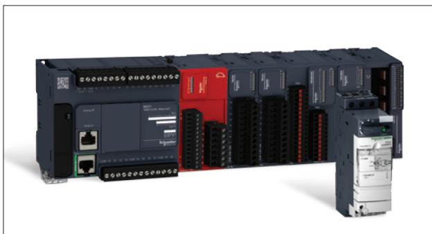
Obr. 1. Modicon M221 (zcela vlevo) ve standardním provedení společně s rozšiřujícími moduly řady TM3

/výstupy (I/O) a dvěma analogovými vstupy na základní jednotce (CPU). K dispozici je jak standardní, tak úzký (tzv. book ) modulární formát. Svou konstrukcí a rozměry Modicon M221 spadá do kategorie tzv. mikroPLC, avšak výkonem procesoru s taktem