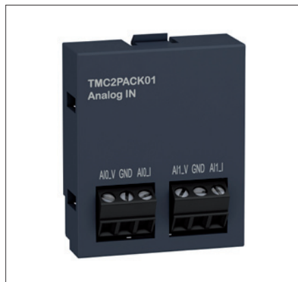
Obr. 2. Zásuvné moduly se instalují přímo do CPU a rozšiřují možnosti PLC Modicon M221 např. o další dva analogové vstupy

velká paměť, značná flexibilita po stránce komunikačních rozhraní i vstupů a výstupů a intuitivní vývojové prostředí SoMachine. „Hyperaktivní dvojčata“ Modicon M241 a Modicon M251 si již získala první příznivce z řad výrobců strojů (OEM), software SoMachine v aktuální verzi V4.1 si stáhly desítky uživatelů. Nastal čas uvést na český a slovenský trh „benjamínka“ z nové generace – všestranný Modicon M221.