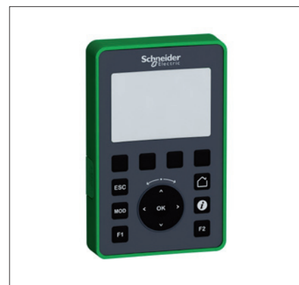
Obr. 4. Ke spojení externího displeje s PLC Modicon M221 postačí sériová linka

Ve výbavě nového PLC nechybí Ethernet, který dovoluje daný stroj programovat a spravovat kdykoliv a odkudkoliv. Výrobce tak neztratí se svými stroji kontakt a pracovníci údržby koncového uživatele doká-