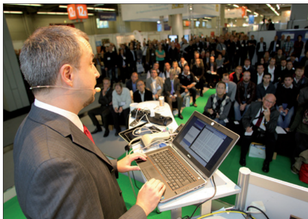
Obr. 1. O ukázkách hackerských postupů je na veletrhu it-sa vždy velký zájem

vedoucí akce ze společnosti NürnbergMesse. České vysoké učení technické v Praze se veletrhu it-sa zúčastní již potřetí a ve vlastní přednášce na fóru představí své aktuální výsledky výzkumu.