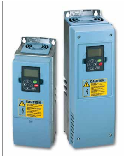
Obr. 2. Univerzální měniče frekvence SLX9000

V některých instalacích je nutné omezit hluk vznikající použitím motoru řízeného