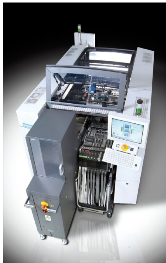
Obr. 1. Automatická osazovací linka Siplace SX

I přes konkurenci ze strany internetu zůstávají veletrhy důležitou součástí globálního marketingového mixu produktů Siplace. Internet se nabízí jako první: je kdykoliv k dispozici a zájemci zde většinou najdou dostatek informací k prvnímu shromáždění základních