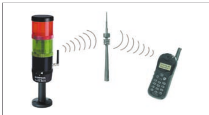
Obr. 1. Signální sloupek s integrovaným vysílačem GSM pro dálkovou signalizaci stavu zařízení

Stejně jako v předešlých vydáních představujeme jeden z produktů z katalogu zásilkové firmy Distrelec. V obsáhlé nabídce výrobků v oddílu automatizace lze nalézt signální sloupky KombiSign, navržené pro optickou a akustickou signalizaci stavu zařízení v průmyslovém prostředí, v budovách nebo v manipulační technice. Modulární provedení umožňuje sestavit sloupek z optických a akustických dílů. Nově lze do sloupku instalovat i vysílač GSM (v katalogu položka č. 565015) a využívat jej k dálkové signalizaci stavu sledovaného zařízení.