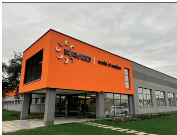
Obr. 1. Nové sídlo firmy Raveo v Otrokovicích není jen účelné, ale i architektonicky hodnotné

Než aby rostli „na dluh“, investují do lidí, protože na jít v současnosti správně lidi