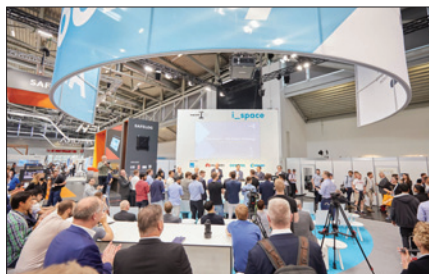
Obr. 2. Součástí veletrhu je bohatý doprovodný program, který se koná přímo na výstavní ploše

Oblast digitální integrace a umělé inteligence řeší témata jako např. rozšířená a virtuální realita, digitální dvojčata a standardy pro propojenou produkci. Udržitelná výroba zahrnuje dosažení výroby neutrální z hlediska emisí CO 2 a cirkulární ekonomiky, vytváře-