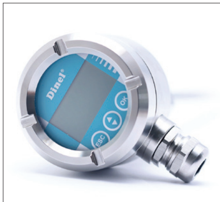
Obr. 2. Snímač GRLM-70 „Miranda“ v celonezrezovém provedení (varianty s označením N)

Snímače RFLS-28 jsou dodávány ve třech mechanických provedeních – s ochrannou korunkou, bez korunky a provedení snímače pro montáž z boku nádoby (obr. 3). Ochranná