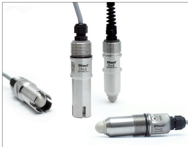
Obr. 3. Vysokofrekvenční limitní snímače RFLS-28

Snímače a hladinoměry Dinel lze uplatnit i v pomocných potravinářských technologiích – např. při přípravě mycích roztoků, při chlazení, měření množství odpadního materiálu apod. Ve farmaceutické výrobě jsou požadavky na produkt obdobné, sanituje se ale častěji parou, proto se používají vysoko-templotní varianty snímačů. Mnohdy se pro výrobu léčiv a preparátů užívají rovněž organická rozpouštědla a hořlaviny, kde se dobře uplatní snímače a hladinoměry v nevybušném provedení.