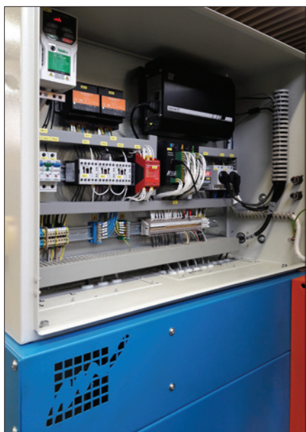
Obr. 1. Rozváděč stroje, který je řízen průmyslovým počítačem DataLab PC a jednotkou vstupů s výstupů Datalab IO se čtyřmi moduly, připojenou prostřednictvím USB; pro obsluhu je k dispozici mimo jiné i dotyková obrazovka

Jednotky průmyslových vstupů se osvědčují v mnoha řešeních jako spolehlivý a velmi efektivní nástroj, pomocí kterého informační a automatizační systémy komunikují s okolním světem. K dispozici je mnoho příkladů a referenčních řešení digitalizace průmyslových výrobních provozů prostřednictvím jednotek DataLab připojených do podnikové sítě TCP/IP, které ukazují pružnost a efektivitu tohoto řešení.