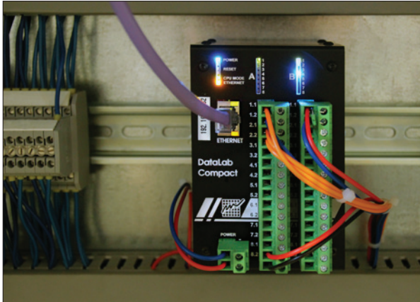
Obr. 3. Jednotka DataLab s připojením na Ethernet TCP/IP a se dvěma vstupně-výstupními moduly

nout konektor bez nutnosti jakékoliv konfigurace. Jednotky připojené prostřednictvím USB jsou také přirozeně odolné proti kybernetickému napadení. Napadnout je lze jen přepojením jejich komunikačního kabelu k jinému zařízení.