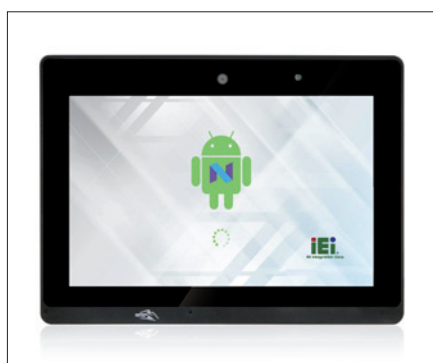
Obr. 1. Panelový počítač AFOCAR-08A – pohled zepředu

Firma IEI Integration Corp. uvádí na trh nový panelový počítač AFOCAR-08A. Jde o bezventilátorový panelový počítač s mikroprocesorem Rockchip RK3399 a operačním systémem Android, což jej předurčuje pro použití v dopravních prostředcích, kioscích a k digitálnímu zobrazování informací s využitím umělé inteligence.