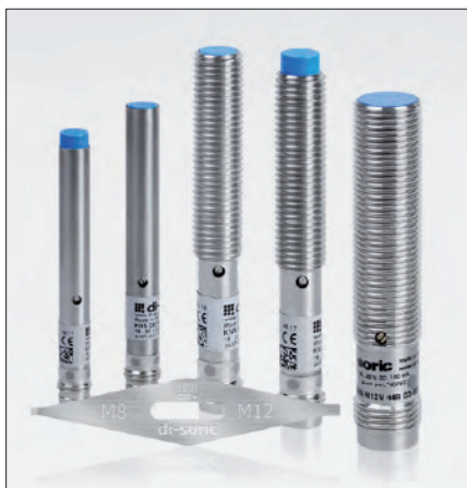
Obr. 1. Kapacitní snímače KNS

Snímače KNS jsou k dispozici s pouzdrem v různém provedení, od průměru 6,5 mm (zapuštěné i nezapuštěné provedení) a se závitem M8 (zapuštěné i nezapuštěné provedení) a M12 (jen zapuštěné provedení). Kapacitní snímače KNS se vyznačují velkou jme-