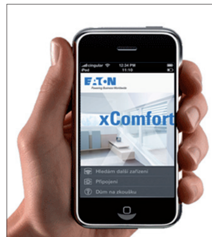
Obr. 2. Program Eaton xComfort, instalovaný v chytrém telefonu, zprostředkuje prostřednictvím internetu komunikaci s jednotkou RF Smart Manager

RF Smart Manager zprostředkuje pomocí internetu dálkové propojení domácnosti s chytrým telefonem. Zajistí kromě ovládání osvětlení, rolet a spotřebičů především zónové řízení vytápění a chlazení, vyhodnocení spotřeby energií, logické řízení domácnosti s časovými a jinými komfortními funkcemi, které jsou také obsaženy v zobrazovací a řídicí jednotce Room Manager. RF Smart Manager je vybaven e-mailovou komunikací, software umožňuje integraci IP kamer a uživatelům dovoluje parametrizovat scény, nastavovat časy, teploty apod.