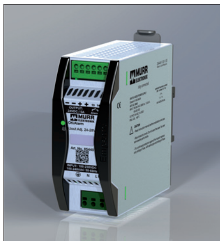
Obr. 1. Spínané zdroje Emparro

Nejvýraznější inovací mezi zdroji – a nejen v rámci nabídky Murrelektronik, ale i globálně – je zcela nová řada Emparro. Spínané zdroje Emparro splňují ty nejnáročnější požadavky moderních výrobců strojů a rozváděčů.