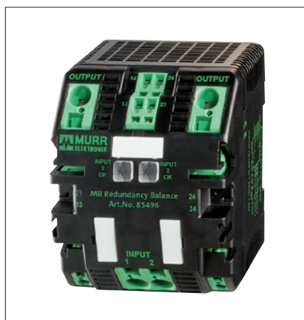
Obr. 2. Modul MB Redundancy Balance

V procesech a provozech, kde z nejrůznějších důvodů nesmí vypadnout napájení, je obvyklé použití dvou shodných zdrojů, každý s výkonem dostatečným na dodávku energie celému provozu, pro případ, že na jedné z napájecích jednotek nastane porucha a jed-