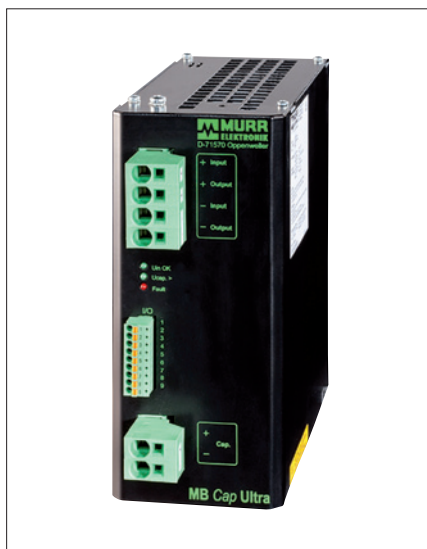
Obr. 3. Vyrovňovací modul MB Cap Ultra

modul. Dokáže zásobovat systém tak dlouho, aby se stroj nezastavil v nebezpečné pozici, aby výrobní linka nepřestala pracovat v mezifázi nebo aby řídicí systém stihl informovat o chybě a bezpečně zálohovat důležitá data. Na rozdíl od záložních zdrojů vybavených akumulátory jsou vyrovňovací moduly řady MB Cap Ultra osazeny vysokokapacitními kon-