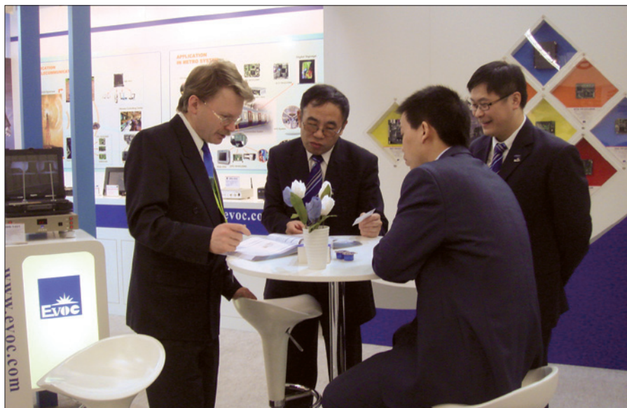
Obr. 1. Expozice společnosti EVOC z předchozího ročníku veletrhu Electronica v Mnichově

zace. Zde se návštěvníci mohou seznámit s širokou nabídkou komponent a integrovaných řešení v automatizaci. Veletrh a souběžně probíhající konference jsou ideálním prostředím k předání informací o produktech, inovacích a současných trendech v oboru, čímž lze získat ucelený přehled o dané problematice. Vystavovatelé a výrobci z oboru průmyslové au-